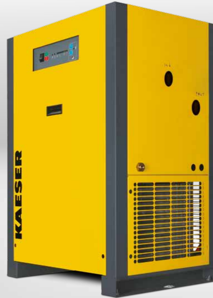
Grundausführung THP 40-50